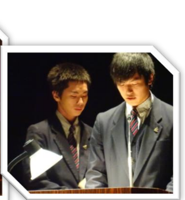
発表会当日の様子です↑↓