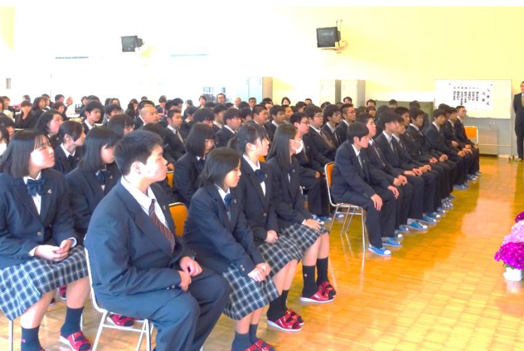
↑ 緊張の面持ちで入寮式に臨む新入寮生

保護者の皆様には,本年度もご支援・ご協力をいただきますよう,どうぞよろしくお願い致します。